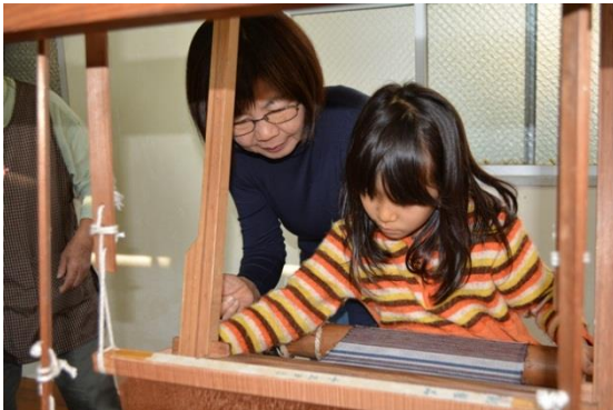
講座風景「大島紬織り体験」