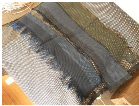
講座風景「瀬戸内町伝統の大島紬（與チラシ）」