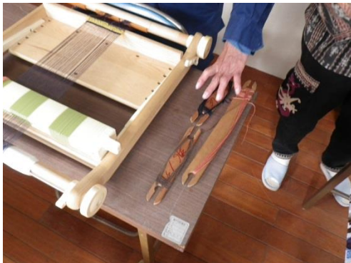
事前準備風景「卓上機セッティング」