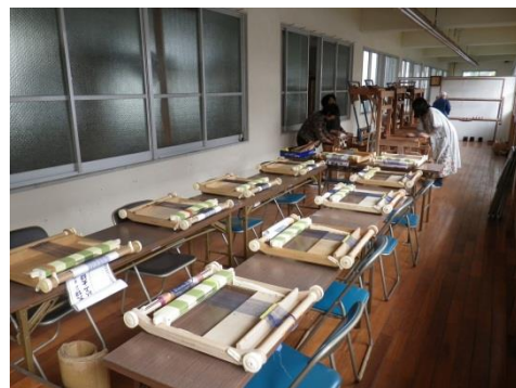
事前準備風景「会場設営②」