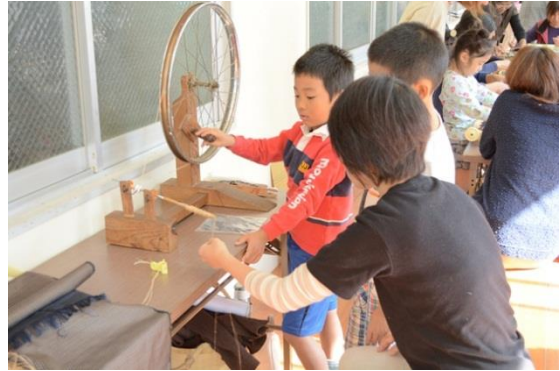
講座風景「芭蕉糸を紡ぐ」