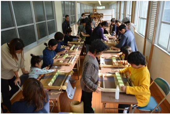
講座風景「芭蕉糸織り体験」