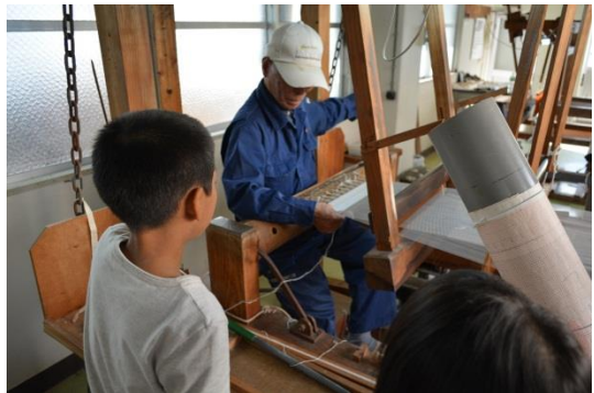
講座風景「大島紬（締め機）見学」