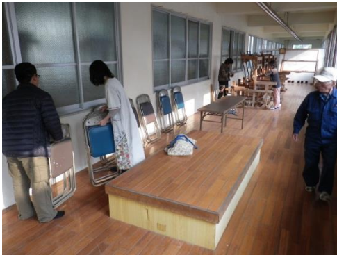
事前準備風景「会場設営①」