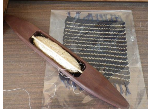
講座風景「芭蕉糸と芭蕉糸を使用した織物」