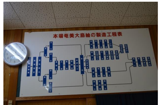
講座風景「大島紬の製造工程」