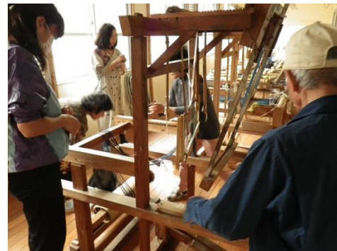
事前準備風景「高機セッティング」